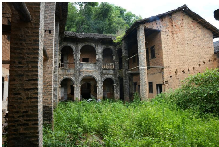
黄汉廷未完工的旧居