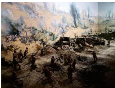
淮海战役（摄于徐州淮海战役纪念馆）