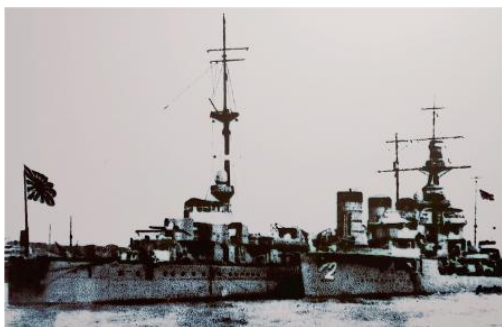
日本军舰云集黄浦江

1932年1月中旬，日寇陈兵上海，并制造日僧三友实业社冲突，寻衅生事。19日，日领事向上海市政府提出多项要求，上海市长吴铁城屈辱妥协，全盘接受。28日晚，日舰队司令盐泽幸一又发通牒，要19路军退防闸北让日军进驻，并于当夜11时30分突袭闸北，遭19路军奋起还击。淞沪抗战拉开序幕。