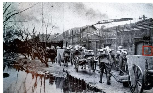
向吴淞进发的日炮队