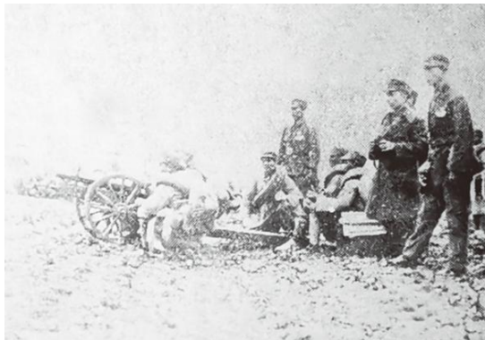
蔡廷锴在前线视察

结识同庚蔡廷锴: 1919年，黄汉廷考取护国军第二军林虎将军在广州北校场办的讲武堂，与蔡廷锴成为同学，两颗赤胆一腔热血，此后他一直跟随蔡廷锴南征北战。