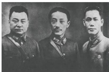
蒋光鼐总指挥（中）、蔡廷锴军长（右）、戴戟司令