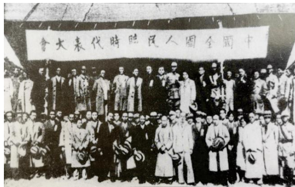
福建事变：中国全国人民临时代表大会代表合照

反蒋联共参闽变: 淞沪抗战结束后，根据《淞沪停战协定》，19路军被换防调至福建反共。但官兵们以抗日为荣，以剿共为耻，于是拥护李济深、陈铭枢、蒋光鼐、蔡廷锴等人为首，联共反蒋抗日，于1933年11月在福建通电成立中华共和国人民革命政府。19路军改称人民革命军第一方面军，黄汉廷任第一军第一师少将副师长。闽变时间仅2个多月，由于兵弱地广、时间仓促等原因，终被蒋介石率10多个师击败。1934年1月，19路军被彻底改编而消亡。