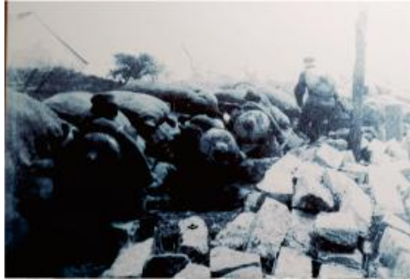
19路军以血肉之躯死守阵地