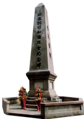
淞沪抗日和籍烈士纪念碑