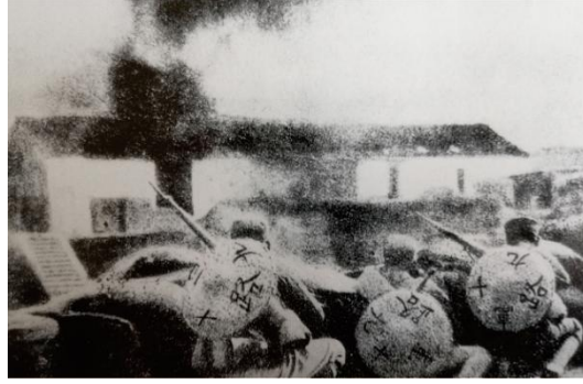
淞沪抗战中的十九路军

反蒋联共参闽变: 淞沪抗战结束后，根据《淞沪停战协定》，19路军被换防调至福建反共。但官兵们以抗日为荣，以剿共为耻，于是拥护李济深、陈铭枢、蒋光鼐、蔡廷锴等人为首，联共反蒋抗日，于1933年11月在福建通电成立中华共和国人民革命政府。19路军改称人民革命军第一方面军，黄汉廷任第一军第一师少将副师长。闽变时间仅2个多月，由于兵弱地广、时间仓促等原因，终被蒋介石率10多个师击败。1934年1月，19路军被彻底改编而消亡。