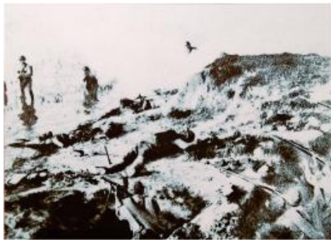
在杨林口，19路军与日军交战情形